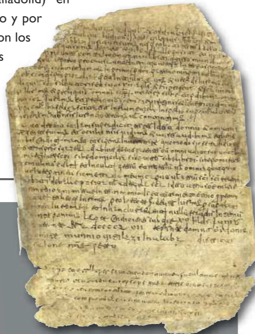
BECERRO DE VALPUESTA, FOLIO 111 R.

El rigor científico y académico de estos materiales está avalado por la presencia de las cuatro universidades públicas de Castilla y León (Burgos, León, Salamanca y Valladolid) en nuestro patronato y por la colaboración con los mejores expertos en el campo de los orígenes de la lengua.